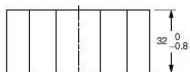
EE70/33/32 полусердечник (EE71/33/32)