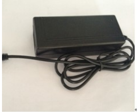
长*宽*高=115mm *47.5mm *32mm